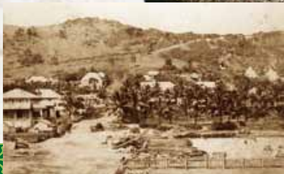
Haut de la place des Cocotiers vers 1875-1880

Du haut au bas de la place des Cocotiers, on trouve :