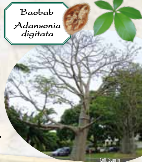
Baobab Adansonia digitata

Son nom vient de l'arabe bu hibab, fruit à nombreuses graines. On en dénombre 4 à Nouméa : au haut-commissariat, au quartier Latin, à RFO et en bordure de route au Trianon.