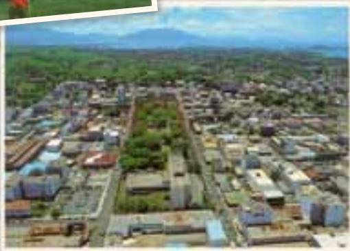
Place des Cocotiers en 1980