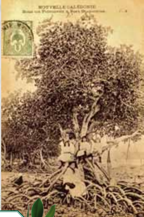
Mangrove en face de Montravel, 2011