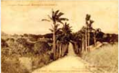
Route de l'hôpital du Marais (CHS de Nouville), coll. MDVN