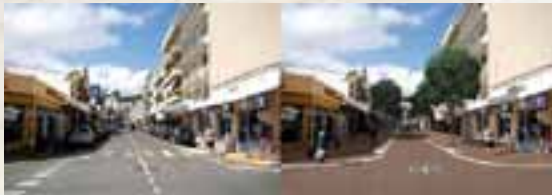
Rue André Ballande Alma