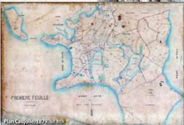
Plan Caujolle, 1879, coll. AVDN

De 1861 à 1869 s'y déroulent les courses de chevaux. Bien que la plage y soit magnifique, elle est longtemps négligée car seul un sentier escarpé permettait d'y accéder. Tout comme sur les autres plages de Nouméa, elle était bordée de palétuviers aveuglants et de vitex, espèces que l'on retrouve aujourd'hui aux environs du Kuendu Beach.