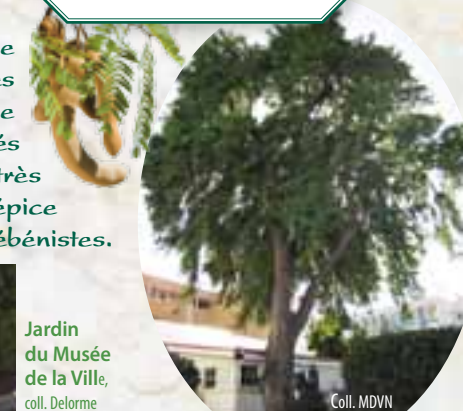
Jardin du Musée de la Ville