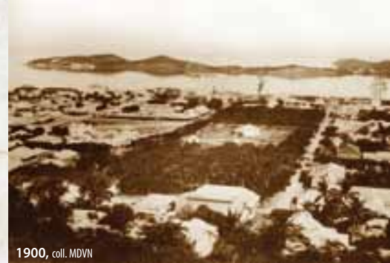
1900, coll. MDVN

La place Feillet porte ce nom depuis 1903, en hommage au gouverneur du même nom. Elle abrite le kiosque à musique inauguré le 14 juillet 1883.