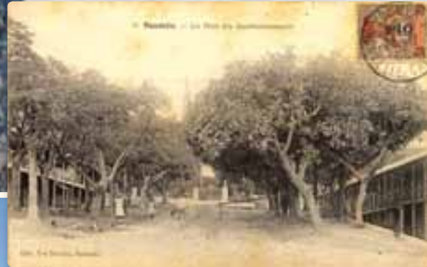
Rue Doumer dans les années 1900

Originnaire d'Asie, il est actuellement répandu dans l'ensemble du monde des tropiques. En Nouvelle-Calédonie, il est présent pratiquement partout en zone basse car il apprécie les sols frais, voire marécageux.