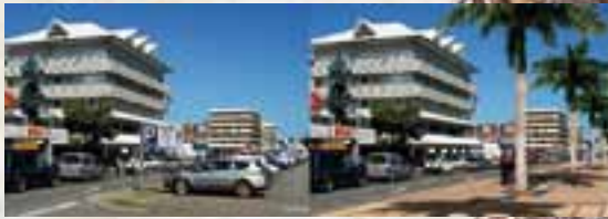
Rue Jules Ferry

Six rues du centre ville ont été identifiées pour être plantées :