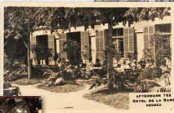
Hôtel de la gare

Ce n'est que récemment que le retour en force des plantes du Pacifique, notamment dans l'aménagement des jardins, des édifices publics et des grands hôtels, vient donner à la ville un cachet plus spécifiquement océanien.