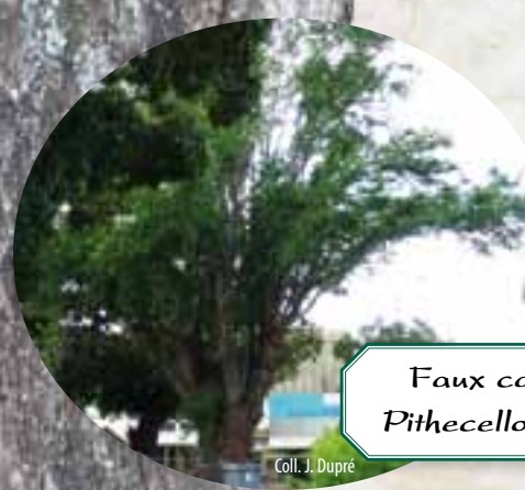
Faux campêche Pithecellobium dulce