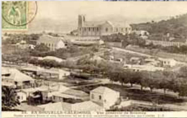
Place Bir Hakeim vers 1900, coll. MDVN

Le nom de place Bir Hakeim lui est attribué en septembre 1943, en souvenir de cette bataille où périrent de nombreux volontaires calédoniens. En 1987, le conseil municipal décide de l'aménager et d'y transférer le monument aux Morts.