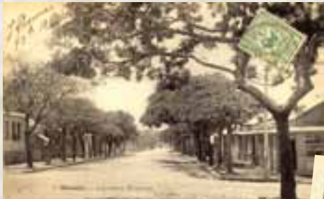
Aujourd'hui rue du maréchal Foch