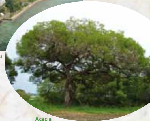
Acacia au Ouen Toro