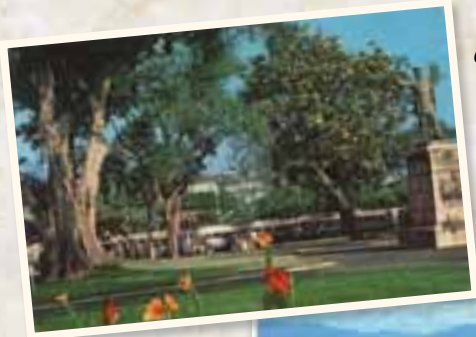
Vers 1960