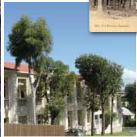
Eucalyptus de la rue Louis de Bougainville, coll. Suprin