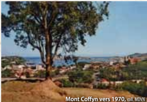
Mont Coffyn vers 1970