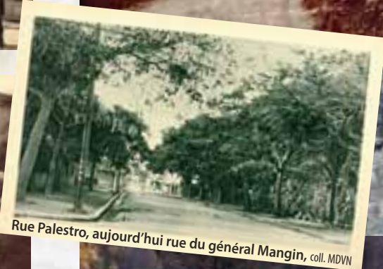
Rue Palestro, aujourd'hui rue du général Mangin