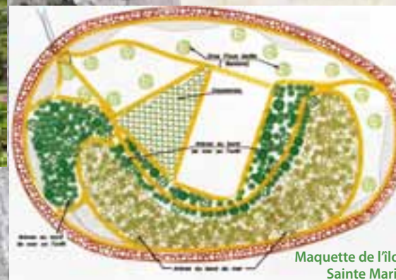
Maquette de l'îlot Sainte Marie

Divers autres espaces, tant de promenade que de réserve, sont en cours de réflexion à travers la ville que ce soit à Tindu , à Sainte-Marie ou à Nouvelle . La municipalité cherche à allier urbanisme et paysage pour répondre à un art de vie prisé par les Nouméens.