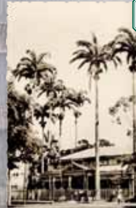
Dans les années 1970