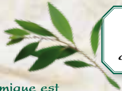
Niaouli Melaleuca quinquenervia

Le premier paysage végétal de la ville naissante est fait de forêt sèche et d'une savane herbeuse à niaoulis et gaïacs.