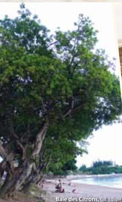
Baie des Citrons

Les beaux banians sont plantés dans les années 1980 lors de l'aménagement paysager de la promenade piétonne du centre commercial de la Baie des Citrons. En mai 2007, un banian du jardin de l'ex-CPS y est transplanté.