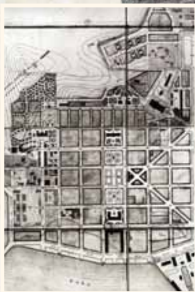
Plan de la ville en 1876, coll. AVDN