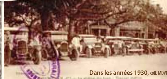
Dans les années 1930