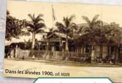
Dans les années 1900