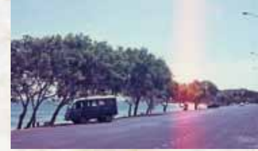
L'Anse Vata vers 1950