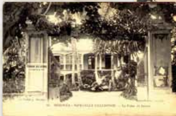
Le palais de justice (aujourd'hui le village)