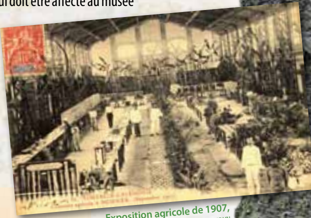
Exposition agricole de 1907

et au jardin d'acclimatation qui l'accompagne. « Ce musée permettrait aux étrangers et aux voyageurs de connaître les éléments de la flore, d'examiner les produits du sol et d'apprécier la richesse minéralogique de Nouvelle-Calédonie. » (séance du conseil privé du 11 octobre 1876)