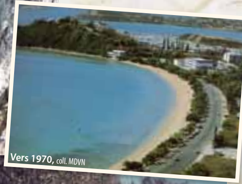
Vers 1970

La promenade dominicale des Nouméens, c'était le tour de l'Anse Vata et elle l'est toujours !