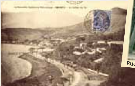
Pour aller à la Vallée du Tir