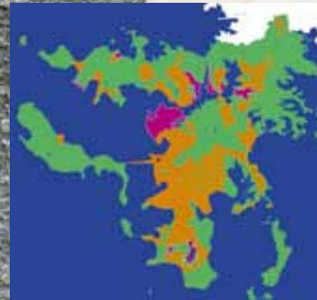
Nouméa 1940-1970 vert : 50 % urbain dense : 30 % urbain diffus : 20 %