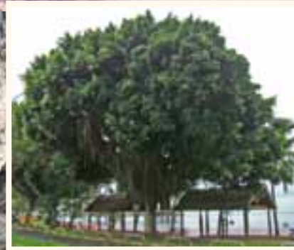
Banien à l'Anse Vata