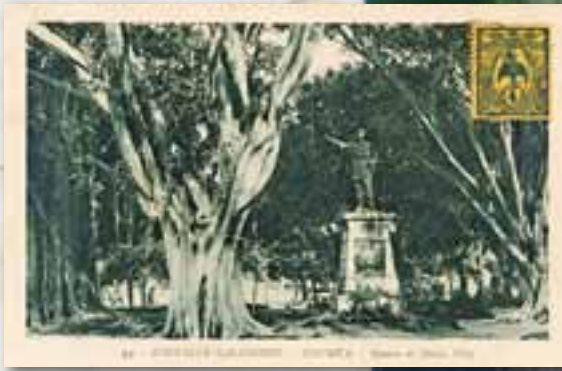
Vers 1900

Le « Jardin Sauvan », nom du maire de Nouméa qui l'a fait aménager en 1892, devient en 1897 le square Olry , nom du vice-amiral Olry dont la statue réalisée par Denys Puech d'après le dessin de Paul Mahoux trône au centre du jardin. En 1933, La France Australe publie une pièce en vers intitulée « Le Square Olry ou le Paradis des poivrots ».