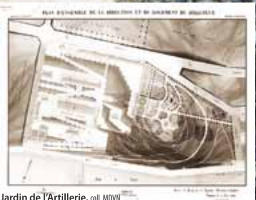
Jardin de l'Artillerie

La végétalisation de Nouméa témoigne de préoccupations très spécifiques aux villes tropicales. Se protéger du soleil et de la chaleur incite à planter de nombreux arbres d'ombrage. Ainsi, des bourao et des acacias sont disséminés dans les rues de la ville. Dès les années 1870, tous les plans des bâtiments publics ou de ceux destinés au culte sont accompagnés d'un projet de jardin.