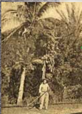
Jardinier forçat du jardin du gouverneur, extrait du livre de Jean Carol, 1903, coll. MDVN