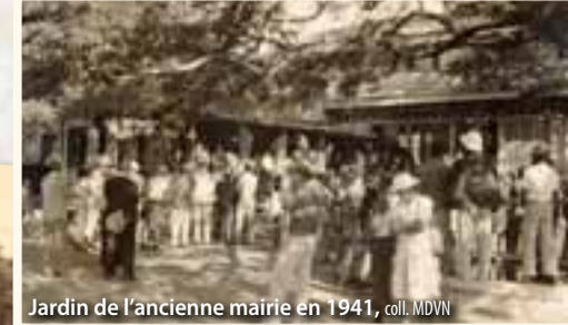
Jardin de l'ancienne mairie en 1941

L'ancienne banque Marchand , aux abords de la place des cocotiers, devient l'hôtel de ville de Nouméa de 1880 à 1975. À l'arrière, se trouvaient la salle des fêtes et un jardin. Une allée goudronnée menait à un bassin de 5 à 6 m de diamètre, avec ses jets d'eau. Autour, tous les emplacements libres étaient couverts de pelouse (buffalo).