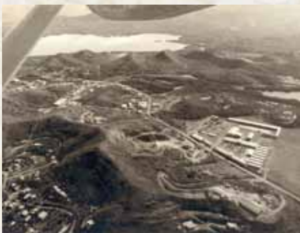
Ducos dans les années 1960, coll. MDVN