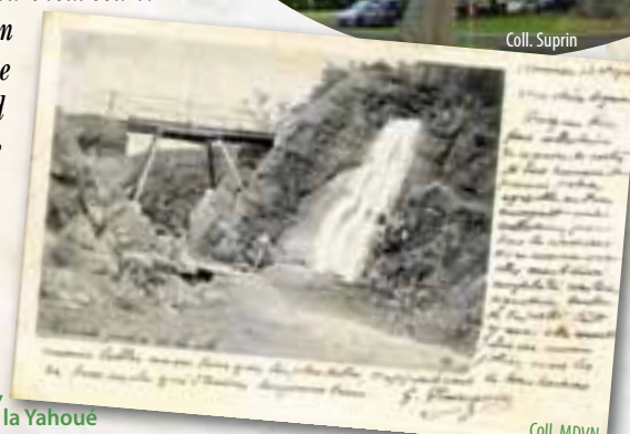
Cascade de la colline aux oiseaux, probablement le trop plein du réservoir de la Yahoué