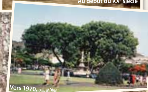
Vers 1970, coll. MDVN

En hommage à l'épisode célèbre des taxis de la Marne lors de la Première Guerre mondiale, la place de la Marne prend ce nom en 1933. Le nom de l'amiral Courbet , gouverneur de Nouvelle-Calédonie, est donné en 1885 à la place qui se situe au bas de la fontaine. Entre les deux, se dresse depuis 1893 une fontaine monumentale ou fontaine Céleste réalisée par le sculpteur Paul Mahoux.