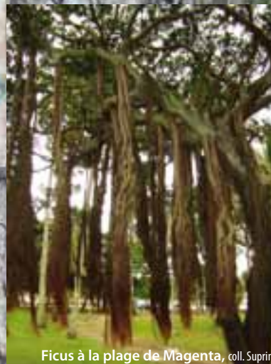
Ficus à la plage de Magenta

La plage du Kendu Beach reste la plage la plus authentique avec une végétation proche de celle des plages nouméennes du XIX e siècle.