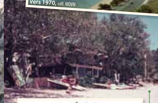
Le Biarritz à l'ombre des martaouis et des palétuviers aveuglants, coll. MDVN

À la fin des années 1980, la municipalité installe un boulo-drome, à l'emplacement du Biarritz qui a été incendié, et plante des banians. Ceux-ci poussent avec une vigueur remarquable. Certains sont des « dortoirs à merles » qui se retrouvent au crépuscule dans un joyeux brouhaha.