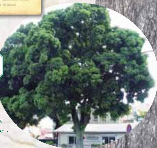
Croix Rouge, rue du Maréchal Foch

On le distingue du bois noir d'Haïti par sa floraison jaune crème, très odorante, vers novembre. Les paysages de plaines de la côte Ouest lui doivent beaucoup de leur beauté. En période de sécheresse, les gousses charnues du bois noir d'Haïti sont très appréciées du bétail.