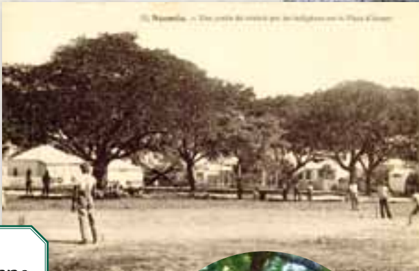
Cricket dans les années 1900