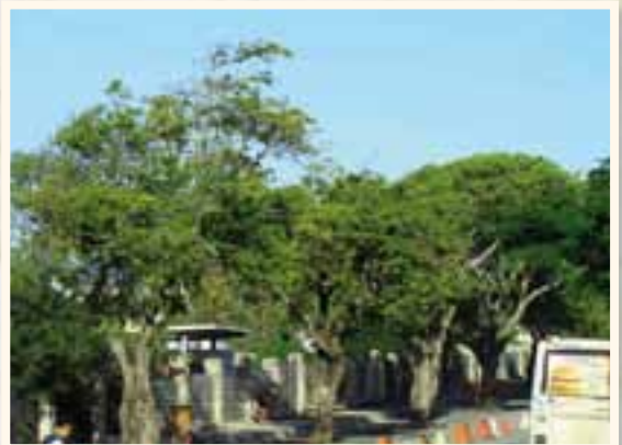
Tamarinier de la rue Carco