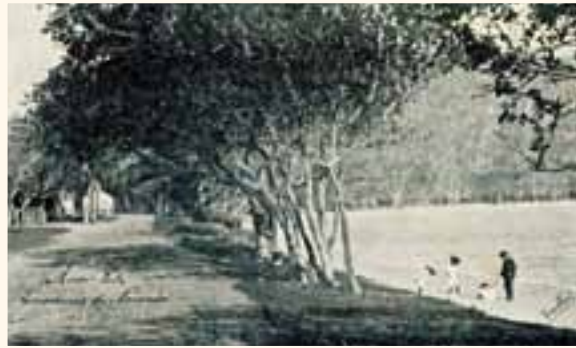
Palétuviers aveuglants, coll. MDVN

« L'anse aux arbres parfumés, l'anse où l'on vient faire son persil, l'anse c'est tout dire pour un calédonien de Nouméa. 1903 »