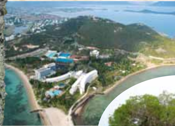
Vue du Ouen Toro, 2011, photo Puglia

Ce n'est qu'en 1956 que la route pour aller au sommet est ouverte au public. En 1989, l'espace devient, à la demande de la ville de Nouméa, un parc territorial et prend le nom de parc du Ouen Toro. C'est une aire de loisirs, mais également l'un des sanctuaires de la forêt sèche de la ville, et donc une zone de conservation de la vie végétale et animale : toute cueillette y est interdite.