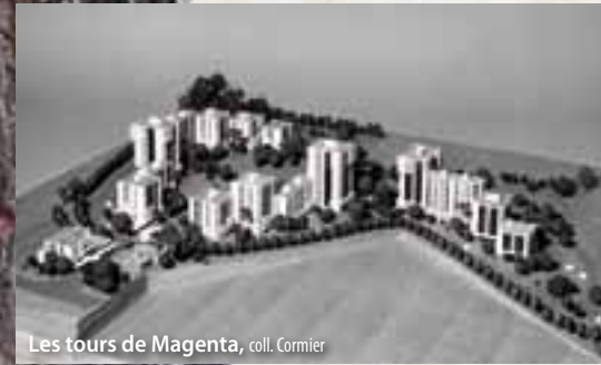
Les tours de Magenta

L'importance d'espace végétalisé avait été déjà prise en compte lors de la construction des tours de Magenta. Depuis 1988, dans le droit de l'environnement, tout nouveau lotissement doit obligatoirement avoir des espaces verts publics.