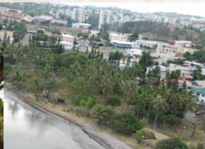
Plage de Magenta

Jean Ohlen serait à l'origine de la mise en place de la plage de Magenta où, après la Seconde Guerre mondiale, il fait planter des pins colonnaires par la mairie de Nouméa. La plage attire les familles pour des pique-niques. Autour de la plage, la pelouse se développe.