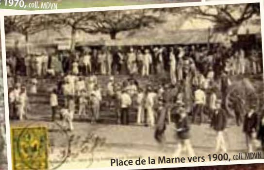
Place de la Marne vers 1900