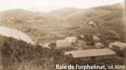
Baie de l'orphelinat

Nouméa 1860 vert : 99% orange : urbain dense : 1 % bleu : 98 % rouge : littoral aménagé : 2 %