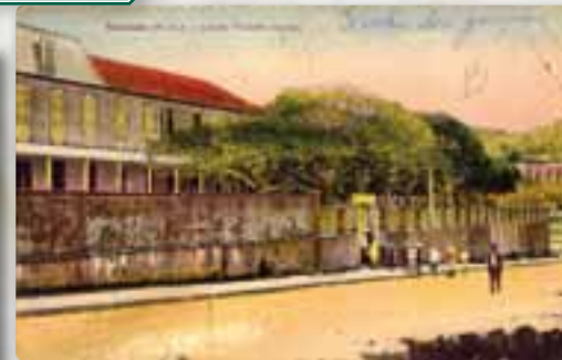
École Surleau, coll. MDVN

De nombreux arbres ombragent les cours des écoles d'hier et d'aujourd'hui.