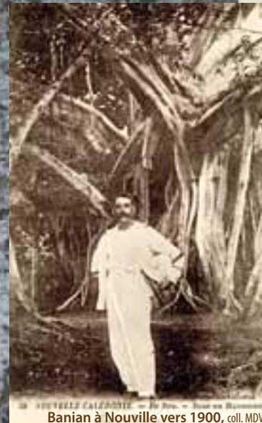
Baniam à Nouville vers 1900