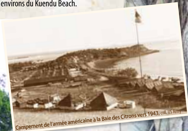
Campement de l'armée américaine à la Baie des Citrons vers 1943, coll. US Army

Les beaux banians sont plantés dans les années 1980 lors de l'aménagement paysager de la promenade piétonne du centre commercial de la Baie des Citrons. En mai 2007, un banian du jardin de l'ex-CPS y est transplanté.