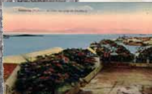
Collège Baudoux