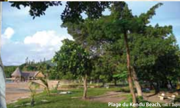
Plage du Kendu Beach

La plage du Kendu Beach reste la plage la plus authentique avec une végétation proche de celle des plages nouméennes du XIX e siècle.