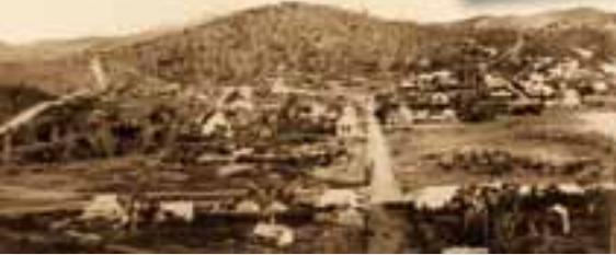
Mont Coffyn vers 1880