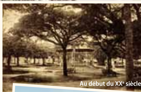
Au début du XX e siècle

Celui-ci accueillit la Musique de la Transportation, puis celle de l'Harmonie municipale et de la Musique de la Garnison. En 1986, il est entièrement reconstruit en houp véritable ; la lyre en métal qui le surplombe reste le seul élément originel. Il demeure aujourd'hui le lieu de réunions et d'animations culturelles et festives.