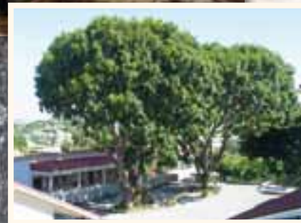
Khaya de l'école Paul Boyer, coll. Suprin

De nombreux arbres ombragent les cours des écoles d'hier et d'aujourd'hui.